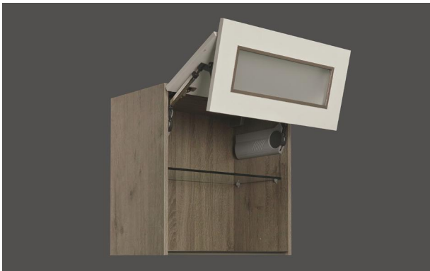
Hängeschrank mit Faltilftür • Faltilftbeschlag mit Dämpfung • Einbau eines Öffnungswinkelbegrenzers ZBHF möglich