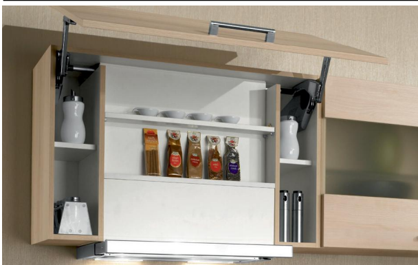
Hängeschrank für Flachschildunstabzugshaube • 1 Lifttür • Links und rechts vom Gerät je ein Regal mit einem festen Boden