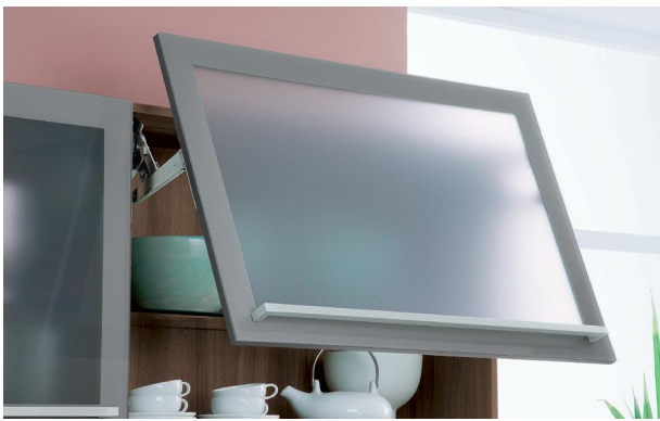
Hängeschrank mit Lifttür • Liftbeschlag mit Dämpfung