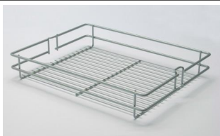
Vorratsauszugschrank • Gitterkörbe mit verbesserter Drahtausführung • Selbsteinzug mit Dämpfung • Gegen Mehrpreis (MHB...) auch mit Holzboden lieferbar

Bitte kein Öl in die Führungsschienen geben!