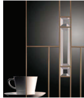
Klarglas mit champagnerfarbiger Bleiverglasung für Glasrahmenfront: Glasart Nr. 17