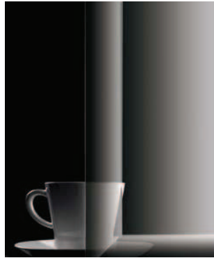
Klarglas mit Facettenschliff für Glasrahmenfront: Glasart Nr. 8