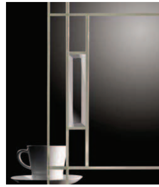
Stilglas, Bleiverglasung für Glasrahmenfront: Glasart Nr. 28