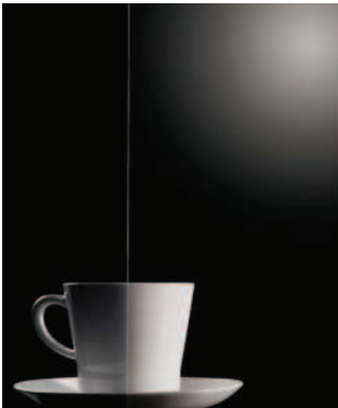
Klarglas für Glasrahmenfront: Glasart Nr. 33 (ESG-Glas: MPSG, Ident-Nr. 66) für Glaslisenenfront: Glasart Nr. 233 (ESG)