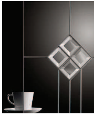
Klarglas, Bleiverglasung champagnerfarbig für Glasrahmenfront: Glasart Nr. 25