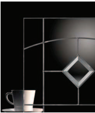
Stilbogen, Bleiverglasung für Glasrahmenfront: Glasart Nr. 21