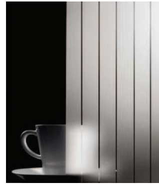
Milchglas mit senkrechten Klarglasstreifen für Glasrahmenfront: Glasart Nr. 38 Achtung! Nur lieferbar für Programm Bougado.